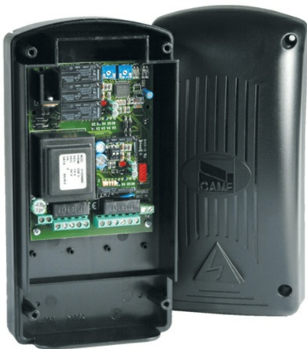
Фото Блок управления для одного привода с питанием двигателя 220В CAME 809QA-0010

Отправьте запрос на коммерческое предложение и получите индивидуальные цены и сроки поставки