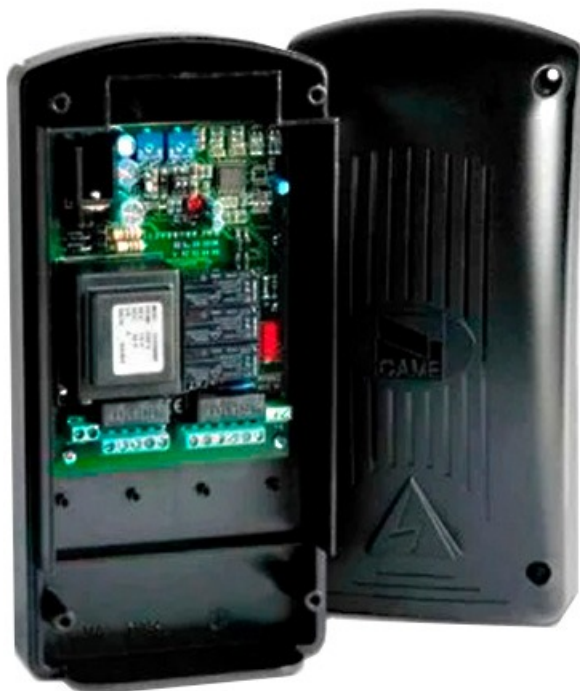
Фото Блок управления ZR24 CAME 002ZR24

Отправьте запрос на коммерческое предложение и получите индивидуальные цены и сроки поставки