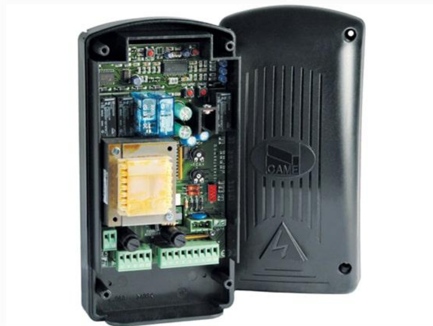
Фото Блок управления ZE5 CAME 002ZE5

Отправьте запрос на коммерческое предложение и получите индивидуальные цены и сроки поставки