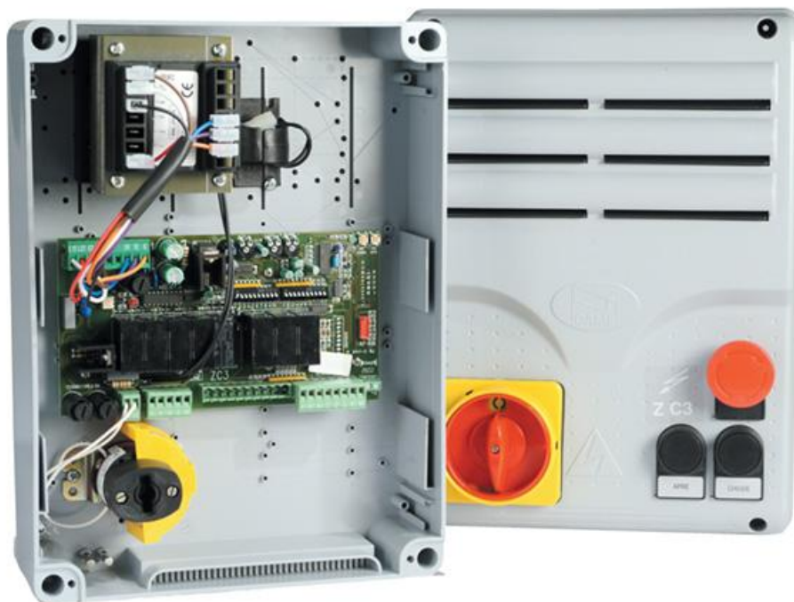
Фото Блок управления ZC3C CAME 002ZC3C

Отправьте запрос на коммерческое предложение и получите индивидуальные цены и сроки поставки