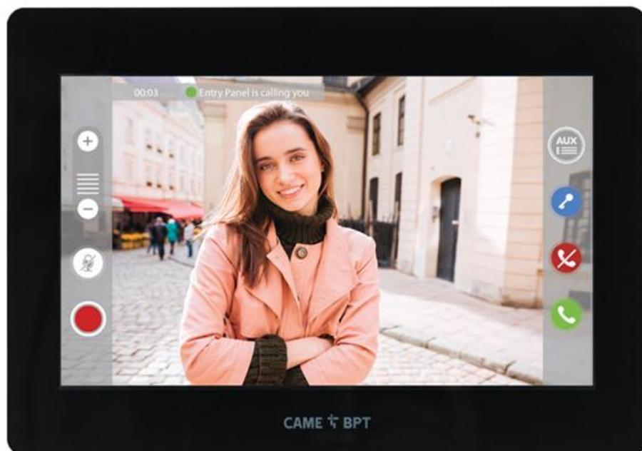
Фото Абонентское устройство XTS 7 BK WIFI CAME 840CH-0040

Отправьте запрос на коммерческое предложение и получите индивидуальные цены и сроки поставки