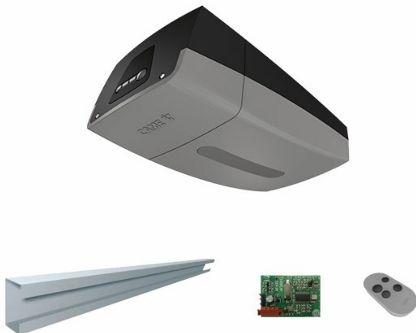
Фото Комплект автоматики для секционных ворот до 3,2 м CAME VER06DES 3,2 KIT

Отправьте запрос на коммерческое предложение и получите индивидуальные цены и сроки поставки