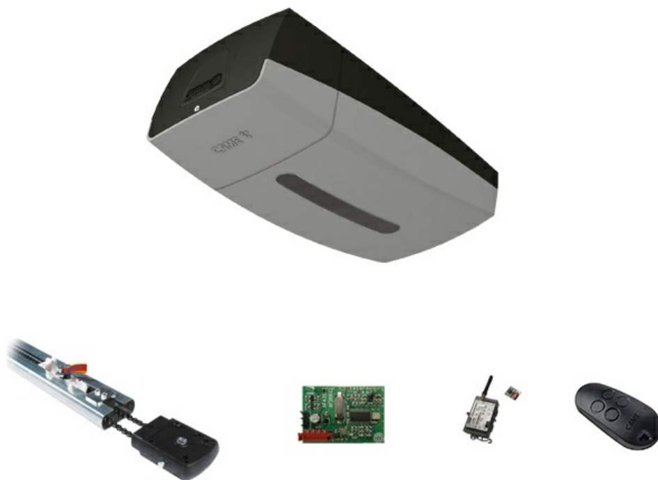
Фото Комплект автоматики для секционных ворот до 3,25 м VER13DMS GSM Connect CAME V13DMS3.25_GSM_KIT

Отправьте запрос на коммерческое предложение и получите индивидуальные цены и сроки поставки