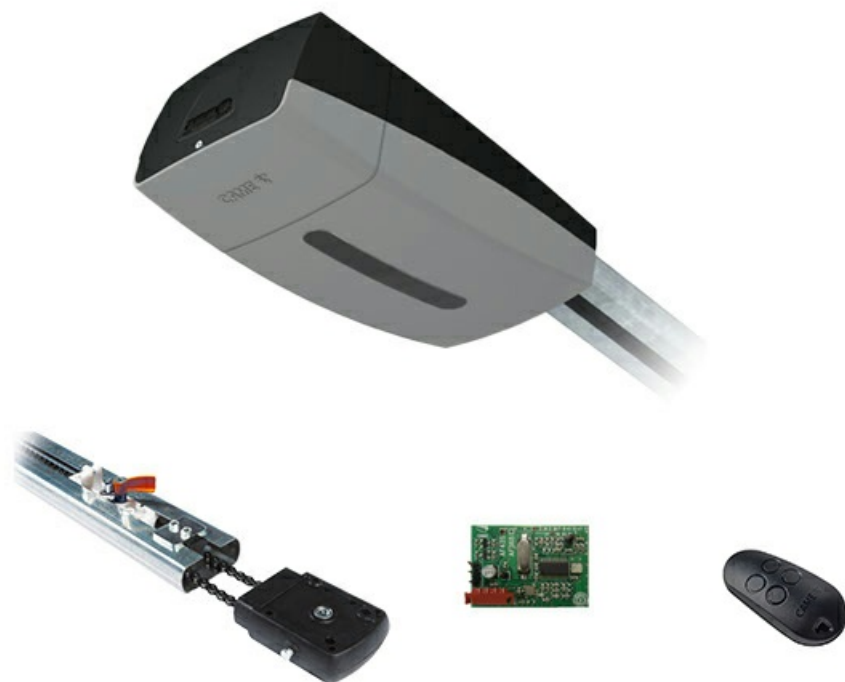
Фото Комплект автоматики для секционных ворот высотой до 3,25 м на основе привода VER10DMS (встроенный блок управления, радиоуправление с фиксированным кодом, направляющий профиль) CAME V10DMS+V0683

Отправьте запрос на коммерческое предложение и получите индивидуальные цены и сроки поставки