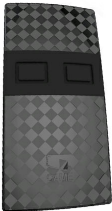
Фото Набор брелоков-передатчиков TW2EE/10 CAME TWIN2EE/10

Отправьте запрос на коммерческое предложение и получите индивидуальные цены и сроки поставки