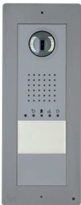
Фото Вызывная видеопанель THANGRAM с одной кнопкой, технология X1, цвет серый CAME TKITVX1-1

Отправьте запрос на коммерческое предложение и получите индивидуальные цены и сроки поставки