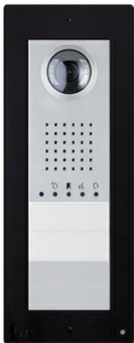
Фото Вызывная видеопанель THANGRAM с одной кнопкой, технология IP 360, цвет металл CAME THANGRAM-R03

Отправьте запрос на коммерческое предложение и получите индивидуальные цены и сроки поставки