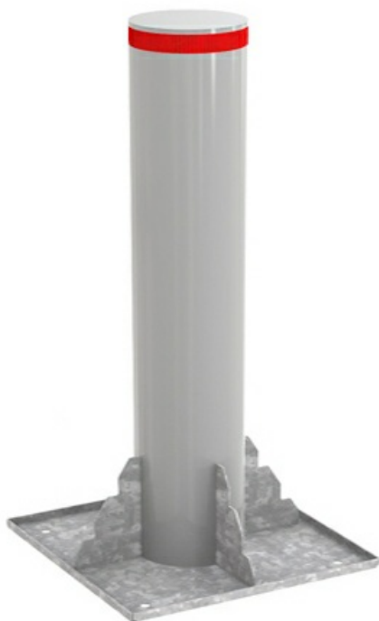
Фото Блокиратор стационарный серии TBD Traffic Regulation диаметр 270 высота 1000 мм RAL9006 CAME TBD-270S100

Отправьте запрос на коммерческое предложение и получите индивидуальные цены и сроки поставки