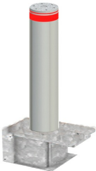
Фото Блокиратор съемный серии TBD 220S900 RMB CAME TBD-220S90-RMB-INOX

Отправьте запрос на коммерческое предложение и получите индивидуальные цены и сроки поставки