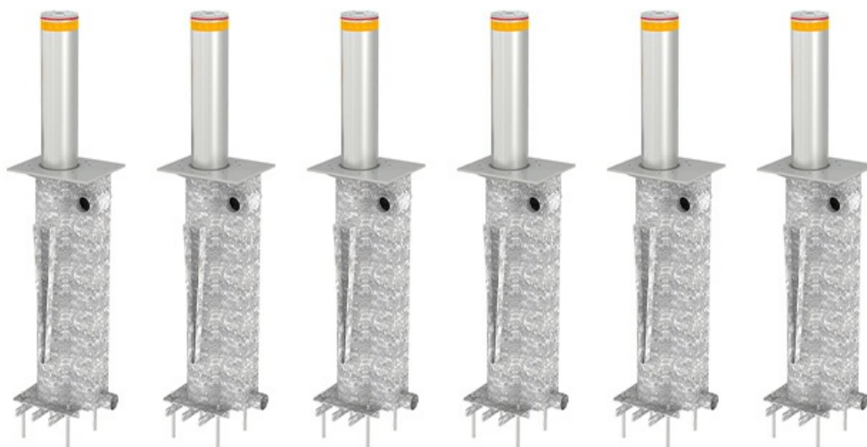
Фото Блокиратор автоматический выдвижной серии TBD Traffic Regulation 220 мм, 800 мм, 6 боллардов CAME TBD-220H80-6

Тел: +7 499 681-75-28 | Email: sale@came-russia.ru | https://came-russia.ru