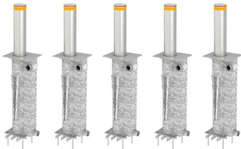
Фото Блокиратор автоматический выдвижной серии TBD Правила дорожного движения CAME TBD-220H80-5

Тел: +7 499 681-75-28 | Email: sale@came-russia.ru | https://came-russia.ru