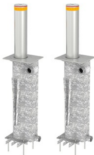
Фото Блокиратор автоматический выдвижной серии TBD, диаметр 220, высота 600 мм, 2 болларда CAME TBD-220H60-2

Тел: +7 499 681-75-28 | Email: sale@came-russia.ru | https://came-russia.ru