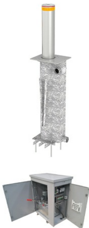
Фото Блокиратор автоматический выдвижной серии TBD CAME TBD-220H60-1

Отправьте запрос на коммерческое предложение и получите индивидуальные цены и сроки поставки