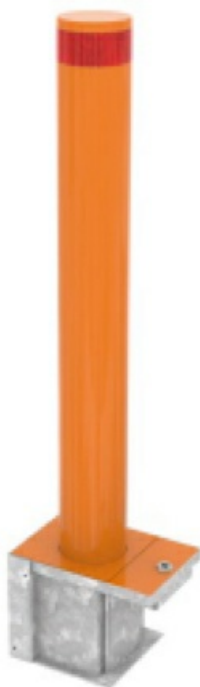
Фото Блокиратор съёмный серии TBD Traffic Regulation CAME TBD-114S90-RMB

Отправьте запрос на коммерческое предложение и получите индивидуальные цены и сроки поставки