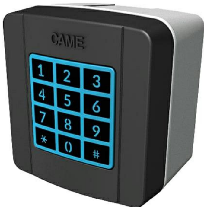
Фото Клавиатура кодонаборная накладная с синей подсветкой CAME 806SL-0150

Отправьте запрос на коммерческое предложение и получите индивидуальные цены и сроки поставки