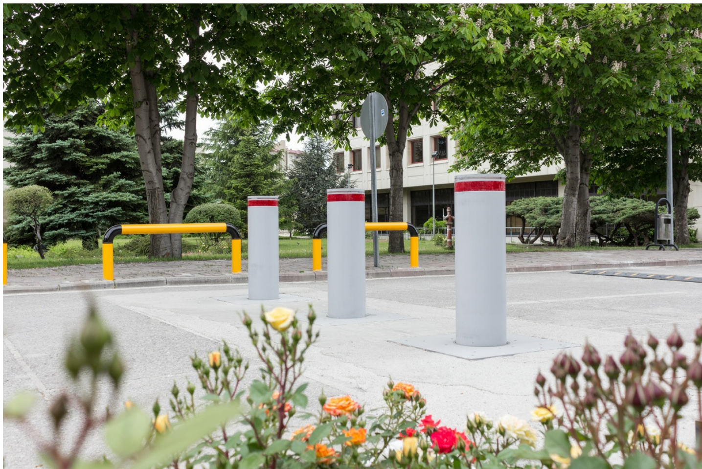
Фото Монтажное основание для съемного блокиратора HBD поверхностного монтажа, SRF K12 CAME RMB-RL-SRF12-SHLW

Отправьте запрос на коммерческое предложение и получите индивидуальные цены и сроки поставки