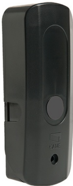
Фото Беспроводной модуль для подключения чувствительных профилей к системе RIO v2.0 CAME 806SS-0020

Отправьте запрос на коммерческое предложение и получите индивидуальные цены и сроки поставки