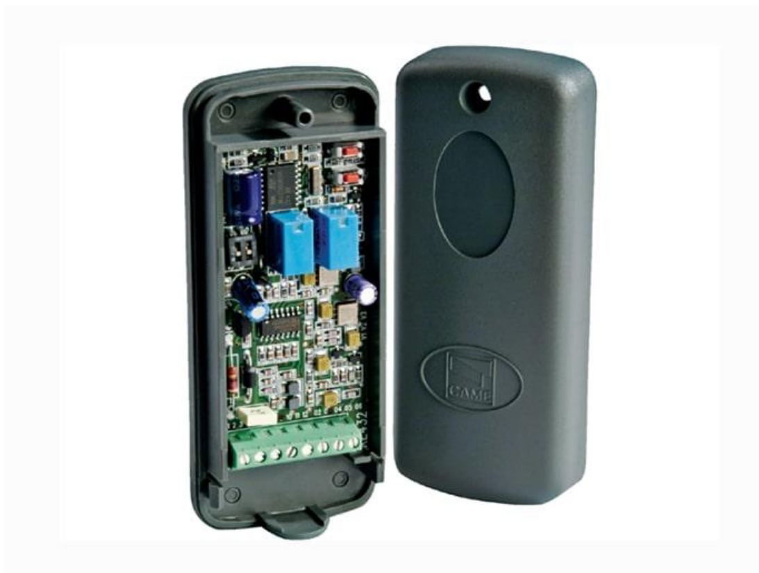
Фото Радиоприемник 2-х канальный для внешней установки и брелоков-передатчиков с динамическим кодом CAME RE432RC

Отправьте запрос на коммерческое предложение и получите индивидуальные цены и сроки поставки