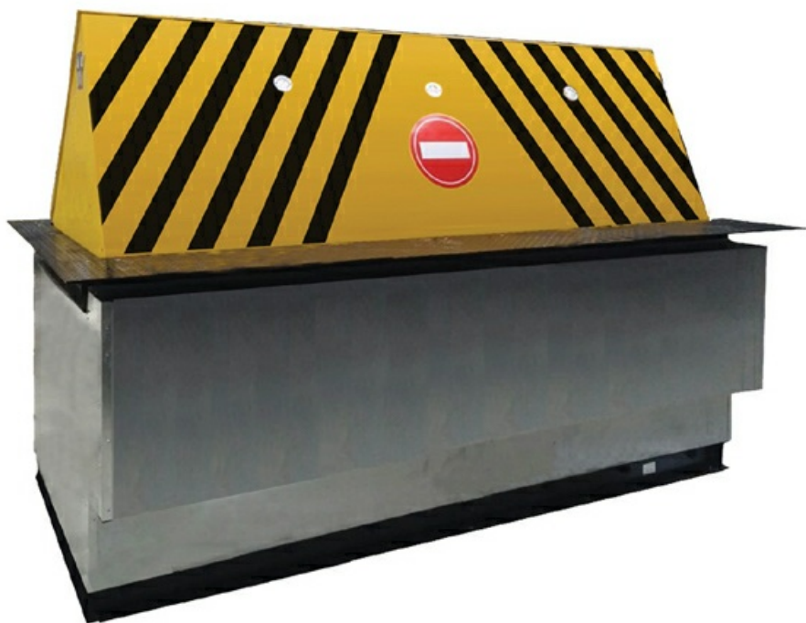
Фото Блокиратор дорожный RB 600 серии RB для гидравлического привода RB-35F60 CAME RB-35F60

Отправьте запрос на коммерческое предложение и получите индивидуальные цены и сроки поставки