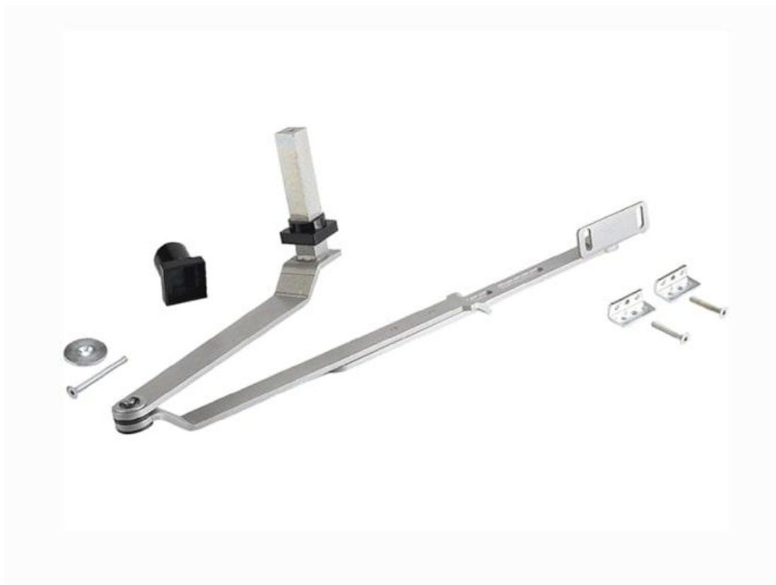
Фото Рычаг для открывания створки наружу (серия FLY) PB1002 CAME 001PB1002

Отправьте запрос на коммерческое предложение и получите индивидуальные цены и сроки поставки