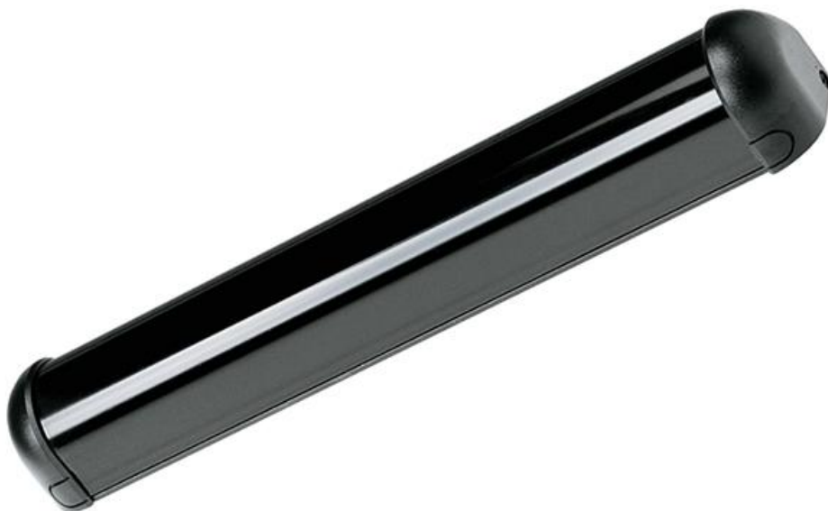
Фото ИК радар безопасности 900 мм для распашных дверей CAME 818XG-0013

Отправьте запрос на коммерческое предложение и получите индивидуальные цены и сроки поставки