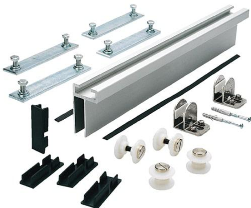
Фото Комплект для 2 створок шириной до 1000 мм или 1 створки шириной до 2000 мм CAME 001MA7570

Отправьте запрос на коммерческое предложение и получите индивидуальные цены и сроки поставки