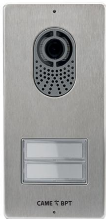
Фото Вызывная видеопанель LITHOS с 2 кнопками, фронтальная панель из сатинированной стали, технология X1, цвет серый CAME LITHOS-R02

Отправьте запрос на коммерческое предложение и получите индивидуальные цены и сроки поставки