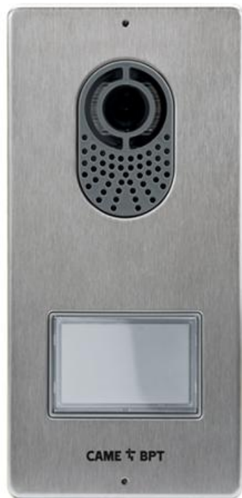
Фото Вызывная видеопанель LITHOS CAME серый LITHOS-R01

Отправьте запрос на коммерческое предложение и получите индивидуальные цены и сроки поставки