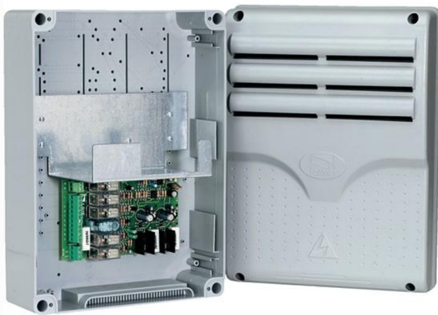
Фото Система аварийного питания LB18 CAME 002LB18

Отправьте запрос на коммерческое предложение и получите индивидуальные цены и сроки поставки