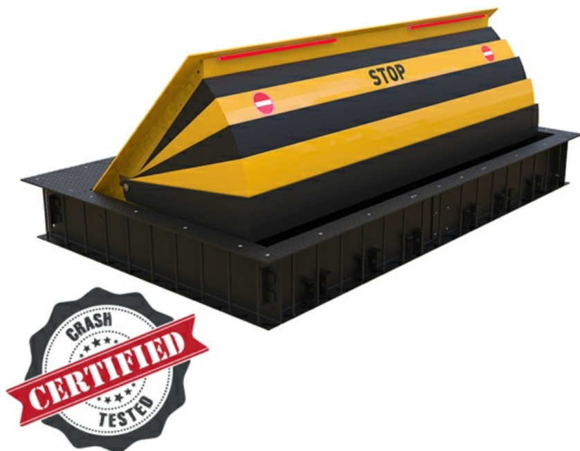
Фото Блокиратор дорожный 900 SHALLOW серии HRB для поверхностного монтажа с двумя гидроцилиндрами HRB-60P90-2p-SHLW-110000000000

Отправьте запрос на коммерческое предложение и получите индивидуальные цены и сроки поставки