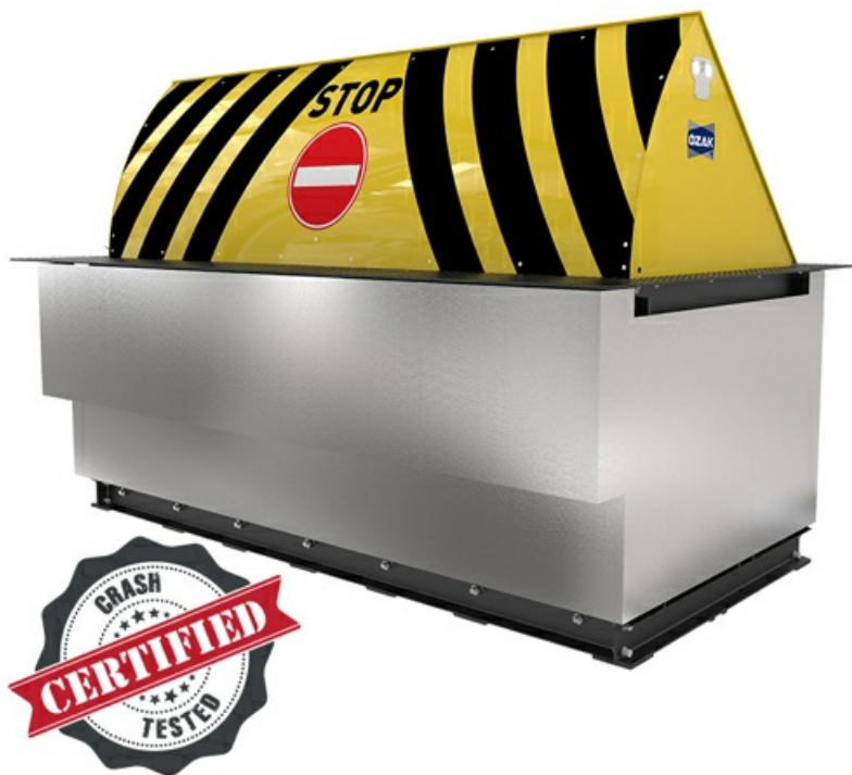
Фото Блокиратор дорожный серии HRB с двумя гидроцилиндрами, длина 4500, высота 900 мм CAME HRB-45R90-2p

Отправьте запрос на коммерческое предложение и получите индивидуальные цены и сроки поставки