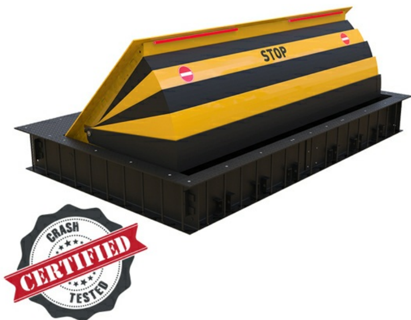
Фото Блокиратор дорожный HRB 900 SHALLOW серии HRB для поверхностного монтажа с двумя гидроцилиндрами CAME HRB-40P90-2р-SHLW

Отправьте запрос на коммерческое предложение и получите индивидуальные цены и сроки поставки