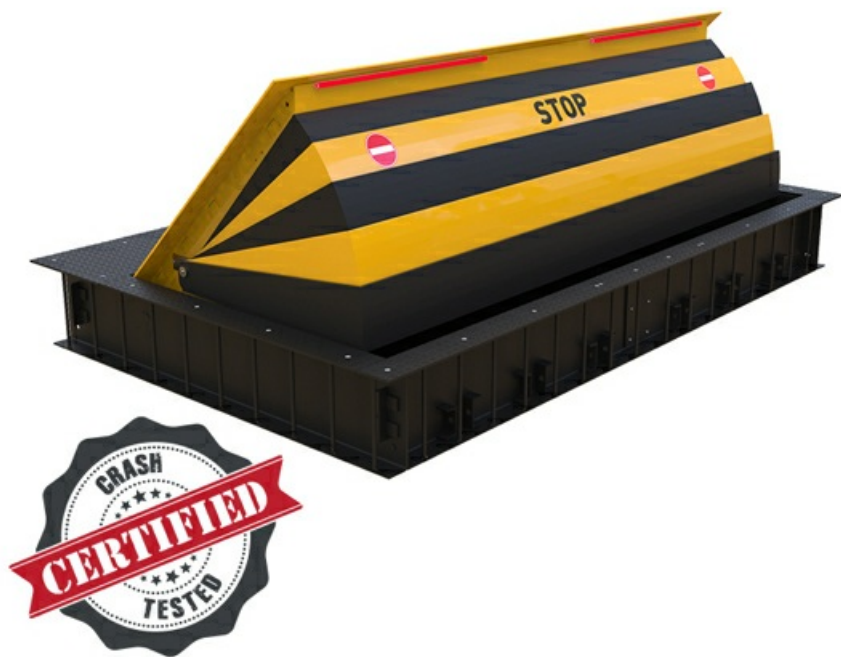
Фото Блокиратор дорожный серии HRB для поверхностного монтажа SHLW CAME HRB-10P90-SHLW

Отправьте запрос на коммерческое предложение и получите индивидуальные цены и сроки поставки