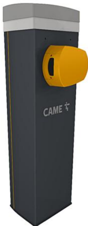
Фото Тумба шлагбаума из оцинкованной и окрашенной стали с бесколлекторным двигателем, класс защиты IP54 CAME 803BB-0120

Отправьте запрос на коммерческое предложение и получите индивидуальные цены и сроки поставки