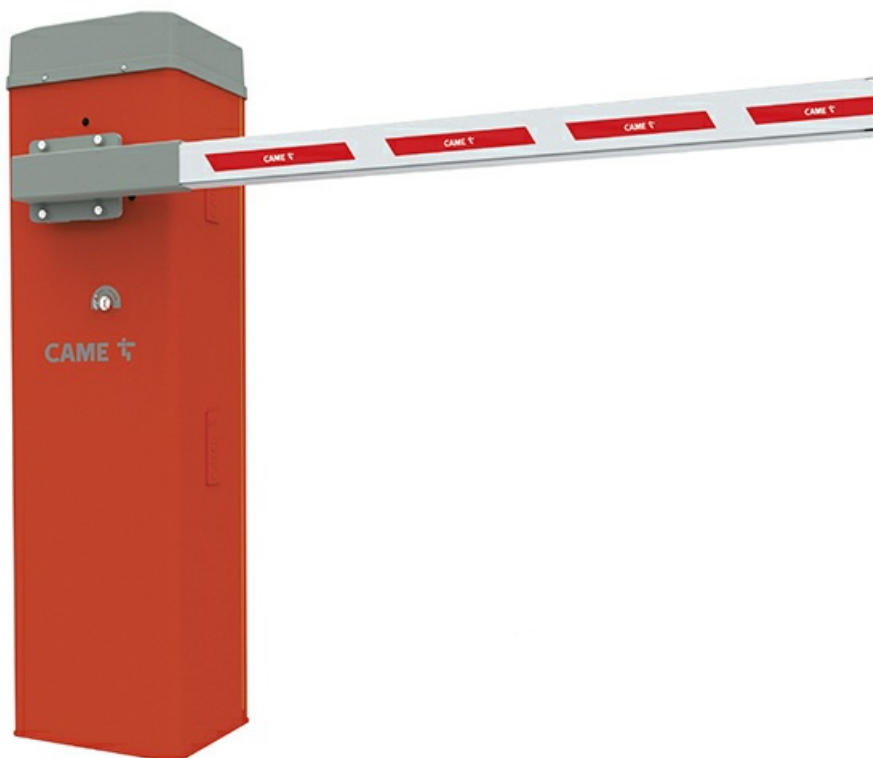
Фото Комплект шлагбаума GARD LT4 combo KIT CAME GLT4 KIT

Отправьте запрос на коммерческое предложение и получите индивидуальные цены и сроки поставки