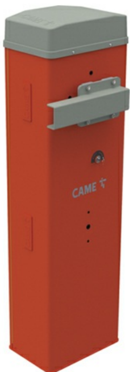
Фото Тумба шлагбаума из оцинкованной и окрашенной стали с возможностью установки дополнительных принадлежностей для проездов до 4 м, класс защиты IP54 CAME 803BB-0370

Отправьте запрос на коммерческое предложение и получите индивидуальные цены и сроки поставки