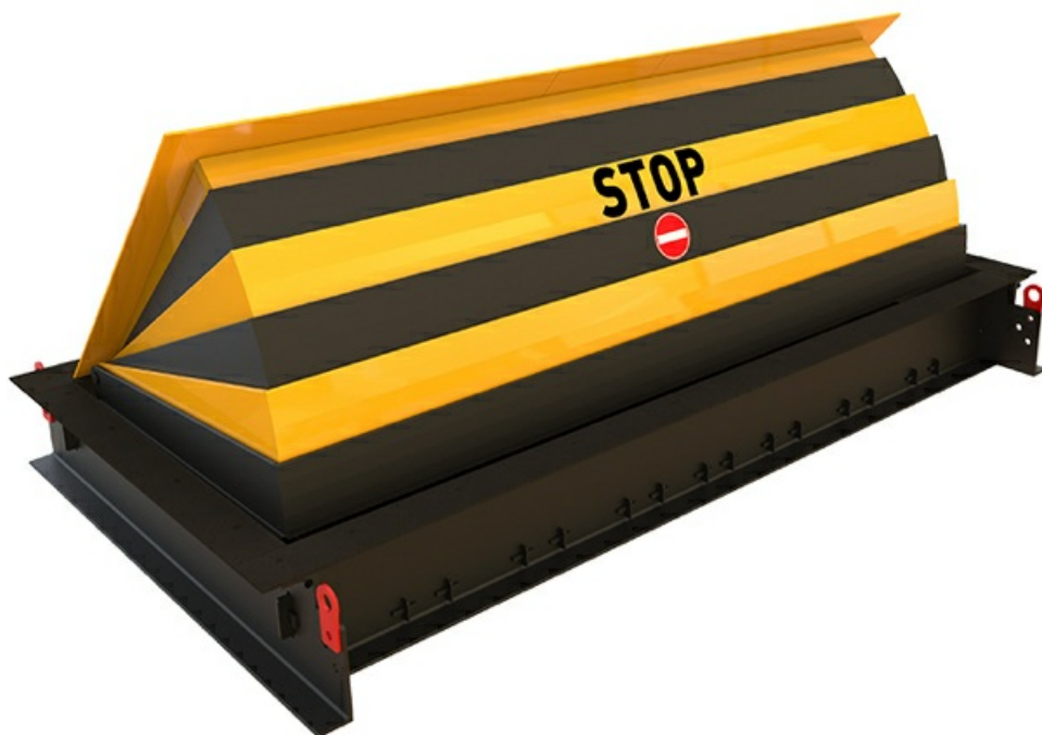
Фото Блокиратор дорожный серии RRB SHALLOW Reinforced усиленный K8 для поверхностного монтажа CAME RRB-35P90-2p-SHLW

Отправьте запрос на коммерческое предложение и получите индивидуальные цены и сроки поставки