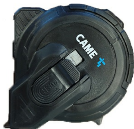
Фото Рулетка Gear X 5 м с функцией медленного/быстрого втягивания черная CAME 604P13.201

Отправьте запрос на коммерческое предложение и получите индивидуальные цены и сроки поставки