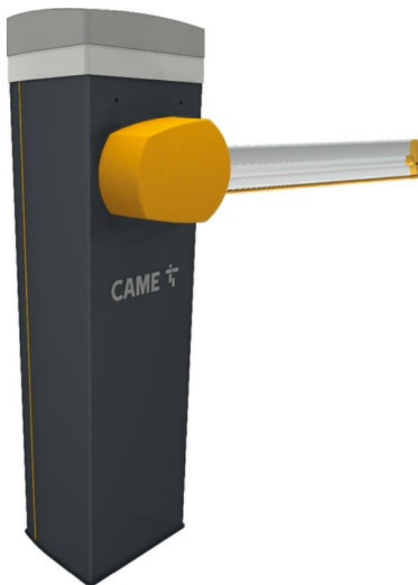
Фото Комплект шлагбаума GARD PX 3 для проездов до 2,8 м CAME GARD PX 3 KIT

Отправьте запрос на коммерческое предложение и получите индивидуальные цены и сроки поставки