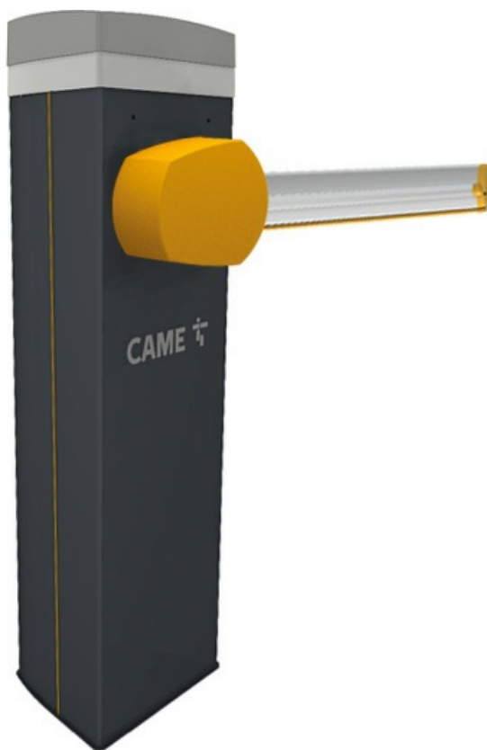
Фото Комплект шлагбаума GARD PT для проездов до 2,8 м CAME GARD PT 3 KIT

Отправьте запрос на коммерческое предложение и получите индивидуальные цены и сроки поставки