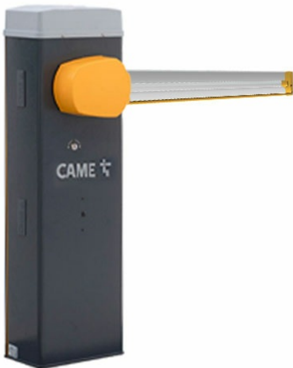
Фото Комплект шлагбаума GARD LS 3 CAME GARD LS 3

Отправьте запрос на коммерческое предложение и получите индивидуальные цены и сроки поставки