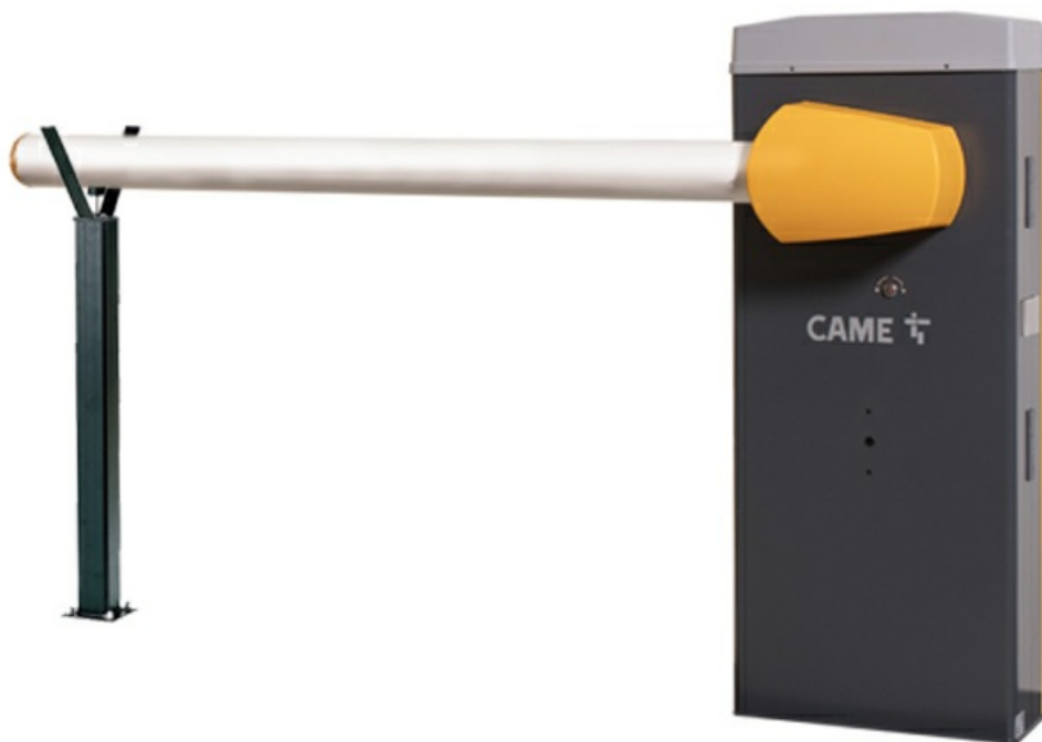
Фото Комплект шлагбаума GARD LS 6 CAME GARD LS6 SET

Отправьте запрос на коммерческое предложение и получите индивидуальные цены и сроки поставки