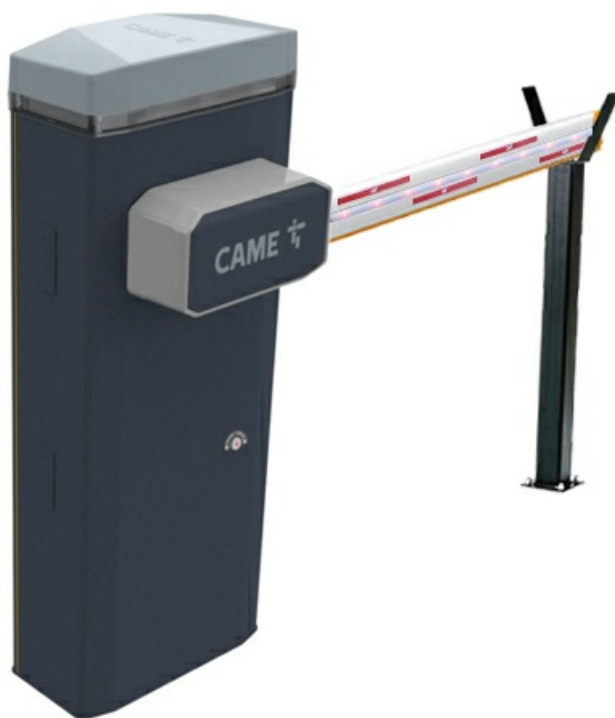
Фото Комплект шлагбаума GARD GT8 для проездов до 6,0 м (тумба, стрела, светодиодная лента, светоотражающие наклейки, опора) CAME GARD GT 8 KIT-6

Отправьте запрос на коммерческое предложение и получите индивидуальные цены и сроки поставки