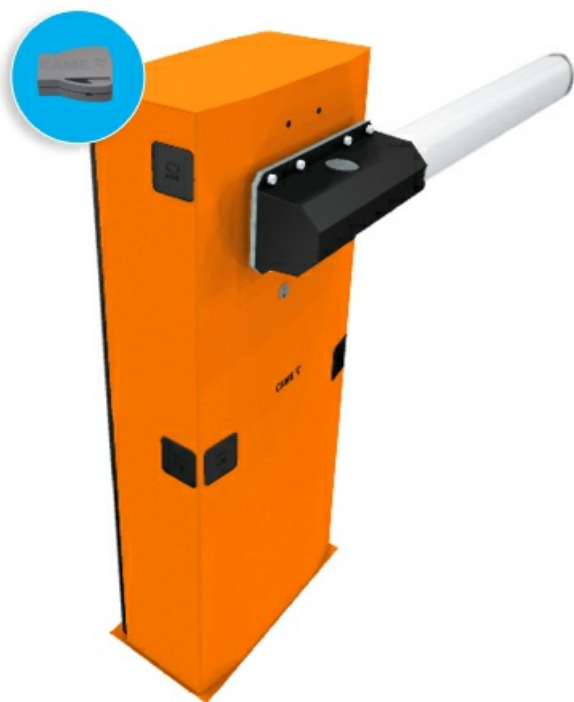
Фото Комплект шлагбаума GARD 6500 с управлением через приложение CAME G6500 Wi-Fi Connect G6500_Wi-Fi_KIT

Отправьте запрос на коммерческое предложение и получите индивидуальные цены и сроки поставки