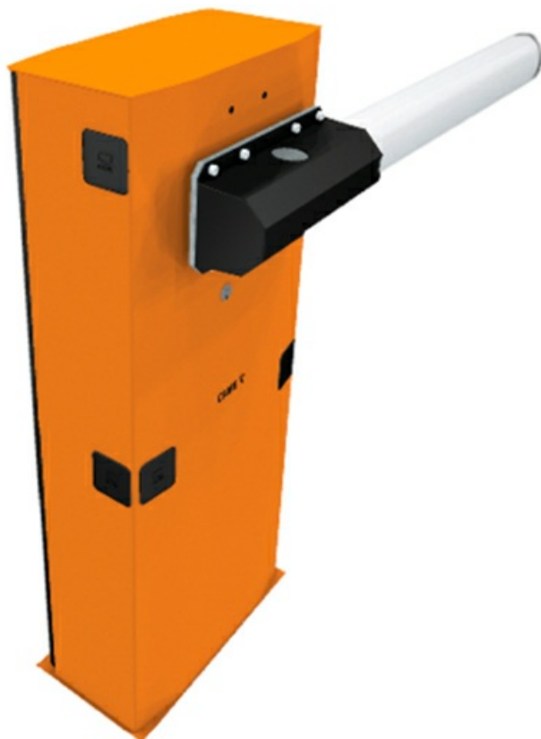
Фото Комплект шлагбаума GARD 6500 CAME G6500 KIT

Отправьте запрос на коммерческое предложение и получите индивидуальные цены и сроки поставки