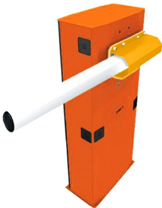
Фото Комплект шлагбаума GARD 5000 Classico левостороннего монтажа CAME G5000SX_KIT

Отправьте запрос на коммерческое предложение и получите индивидуальные цены и сроки поставки