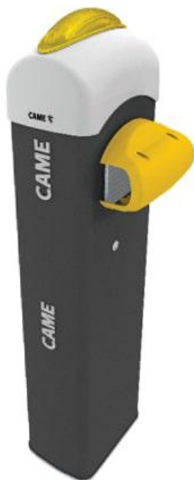
Фото Тумба шлагбаума из оцинкованной и окрашенной стали CAME IP54 001G4040Z

Отправьте запрос на коммерческое предложение и получите индивидуальные цены и сроки поставки