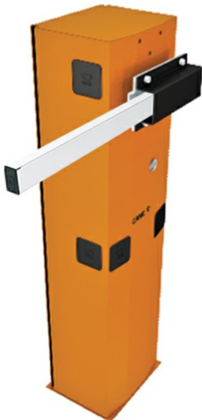
Фото Шлагбаум автоматический G4000 Classico для левостороннего монтажа CAME G4000SX KIT

Отправьте запрос на коммерческое предложение и получите индивидуальные цены и сроки поставки