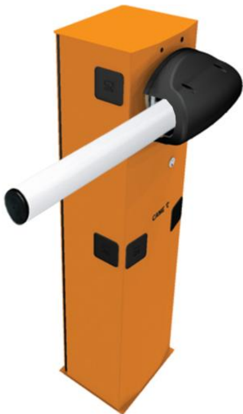
Фото Комплект шлагбаума GARD 3750 для левостороннего монтажа CAME G3750SX KIT

Отправьте запрос на коммерческое предложение и получите индивидуальные цены и сроки поставки