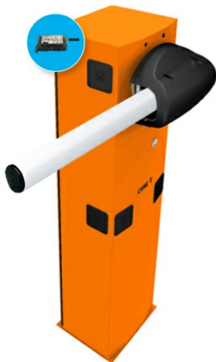
Фото Комплект шлагбаума GARD 3750 для правостороннего монтажа с управлением через приложение CAME G3750SX_GSM_KIT

Отправьте запрос на коммерческое предложение и получите индивидуальные цены и сроки поставки